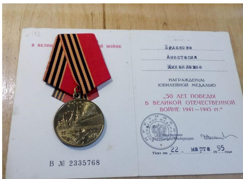
Рис. 3. Медаль и удостоверение к ней «50 лет победы в Великой Отечественной войне 1941-1945гг.»

У моей прабабушки были медали к юбилею победы (рис.3,4,5). Последняя была получена пять лет назад, к 70-летию победы. Хоть она и не являлась прямым участником войны, я обязательно расскажу потом своим детям о ней, чтобы и они помнили и гордились, чтобы знали, что судьба моей семьи была опалена такой жестокой и страшной войной.