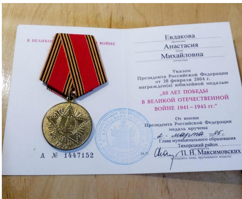
Рис. 4. Медаль и удостоверение к ней «60 лет победы в Великой Отечественной войне 1941-1945гг.»