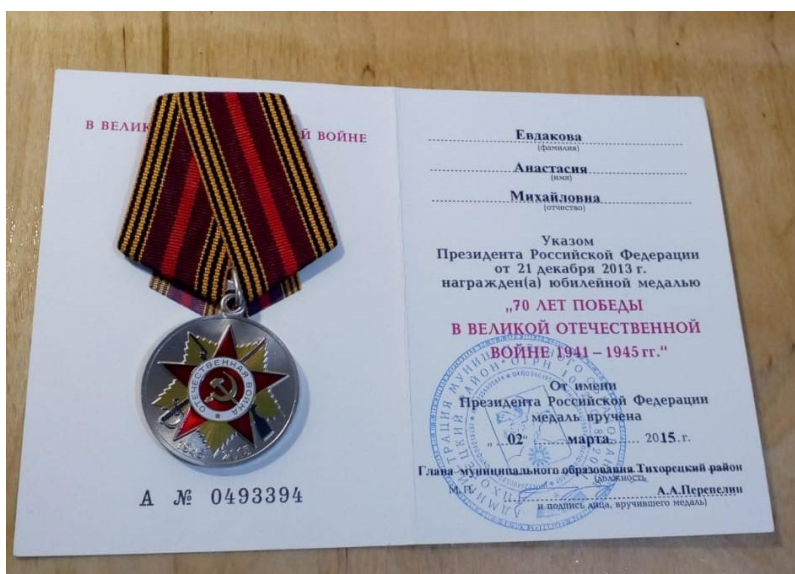
Рис. 5. Медаль и удостоверение к ней «70 лет победы в Великой Отечественной войне 1941-1945гг.»

В 2016 году прабабушка умерла. Спустя столько времени труда на заводе и в поле. Она трудилась очень долго не только в колхозе, но и дома, пока у нее были силы.