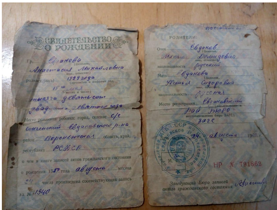
Рис.1. Свидетельство о рождении